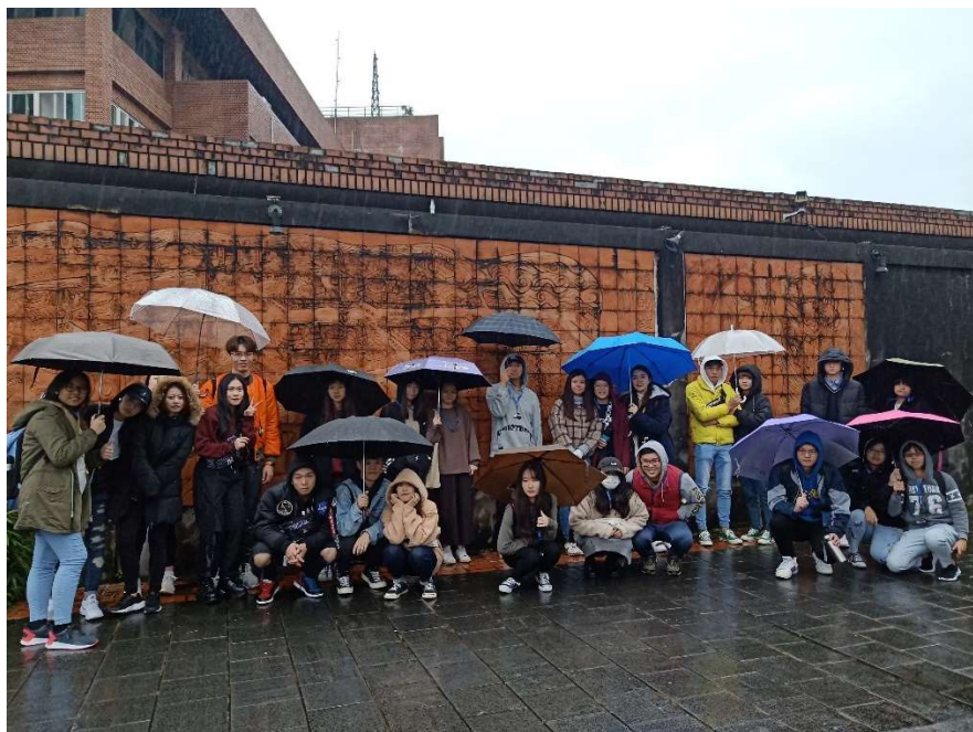
部分參加中文解說團的人員與導覽同學在光大巷的磚牆前合照。