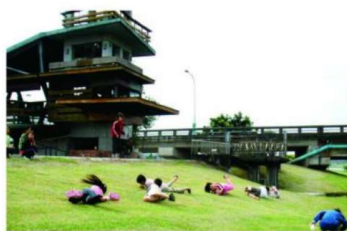
1. 社福大樓旁的西堤屋橋。

為了方便交通，行程從台北車站東三門出發，經由國道抵達宜蘭市，並以宜蘭市維管束計畫為導覽區域，導覽行程以楊士芳紀念林園為起點，行經光大巷、宜蘭社福大樓、西堤屋橋、宜蘭河河濱公園、最後抵達梅津棧道，導覽長度約為兩個小時。依照參加人數的背景，亦分成中文導覽與英文導覽。以下為主要導覽地點圖示：