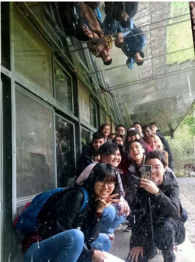
英文導覽團的參與人員與導覽人員於鏡子下方合照。參與人員來自日本、菲律賓、德國、馬來西亞、印尼、香港等國。