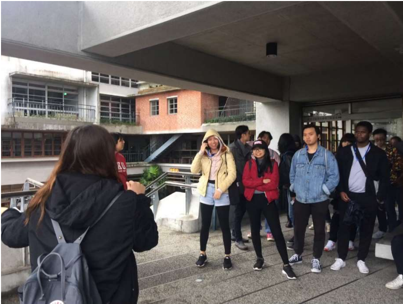
宜蘭社福大樓場域解說。