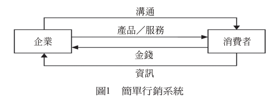
資料來源: Philip Kotler, Marketing Management, Millenium (Englewood Cliffs, N.J.: Prentice-Hall, 2000), pp. 4-5.

自1850年代到1920年代,企業以生產 與產品發展為主。由於市場的擴展,製造商 與中間商合作更加密切,最終才能接觸消費