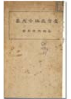
▲《臺灣森林令大要》。