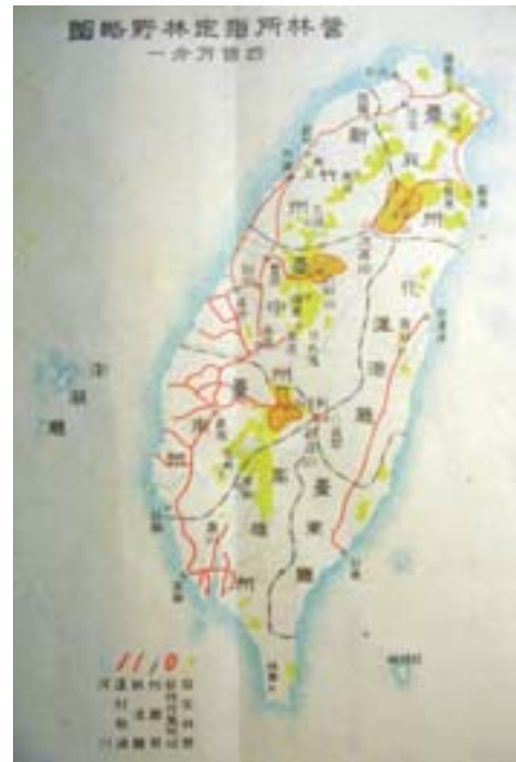
▲「營林所指定林野略圖」。

靠臆測，要了解陌生的臺灣山林林野，必然需要依靠近代林學學術與林業政策的介入。因此，基於殖產經營上事先調查的必要，1896 年 11 月即制訂《森林調查內規》，據之調查臺灣森林概況，以建立林業的基礎。