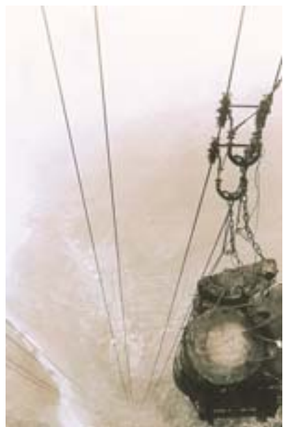
▲太平山林場於 1915 年開始砍伐，以出產檜木為主。大約攝於 1920 年代末期。

1895 年日本領有臺灣，被日人視為「森林國」、「日本版圖內山林寶庫」與「本邦唯一的熱帶林業地域」的臺灣島，成為明治中葉日本帝國唯一位於亞熱帶與熱帶的領土。臺灣山林對殖民統治的重要性在於其所蘊藏的植物與樹木，當殖民者對臺灣進行各方面的統制與分類的同時，殖民地的山林領域必然是相當重要而必須面對的世界，從此臺灣的山林狀況深為日本殖民者所關注，並開始在臺灣著手進行近代林學實驗研究事業，而臺灣低緯度的熱帶與亞熱帶山林林野從此