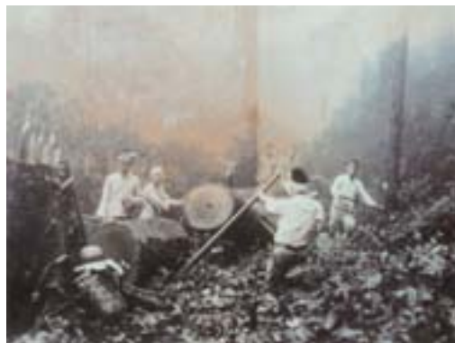
▲臺灣森林收入為日本帝國帶來可觀的經濟效益。圖為伐工剪圓材，約 1934 年。

這四條軸線概略顯示日本領臺初期對臺灣山林林野的肆應。作為殖民地經營者，總督府急於清理的是舊山林林野的產權及其可利用的資產；同時，殖民者也想了解這塊森林面積占 60% 以上，且 2,500 公尺以上高山超過 100 座的南方島嶼，林業財富的蘊含到底「無盡藏」到什麼地步？「無盡藏」無法只