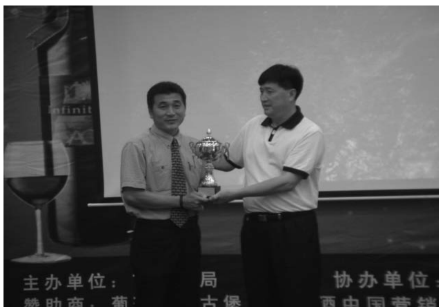
臺灣體育大學榮獲兩岸四地古堡盃足球賽亞軍