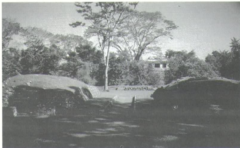
圖一 墨西哥馬雅遺址帕連克 (Palenque) 球場。