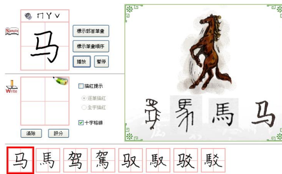
圖 2 偏旁字用習字e筆通學習