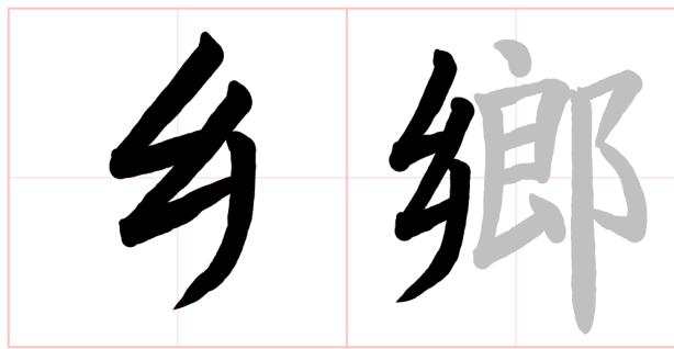
圖 4 部件輪廓相似字用神來e筆學習