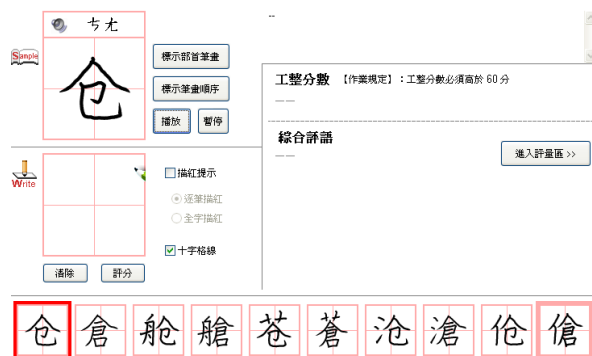
圖 1 偏旁字用習字e筆通學習

增建由簡識正的神來e筆、習字e筆通資料庫。教師可依此作為教學使用輔助工具、或者是學生課後練習的參考資料。第一年先處理字形相似字—偏旁字和部件輪廓相似字。